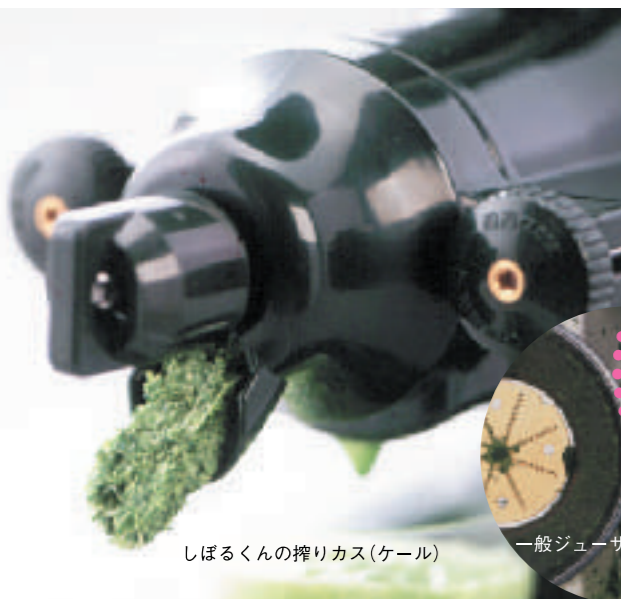
しぼるくんの搾りカス(ケール)